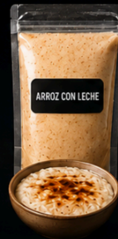
ARROZ CON LECHE

Receta clásica de 3 carnes en recado de tomate y especias. Incluye res, cerdo y pollo (trozo o cuarti).