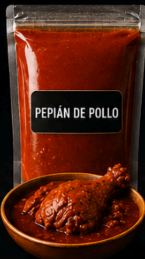
PEPIÁN DE POLLO

Elaborado únicamente con brazuelo, posta y cuero. Sin menudos.