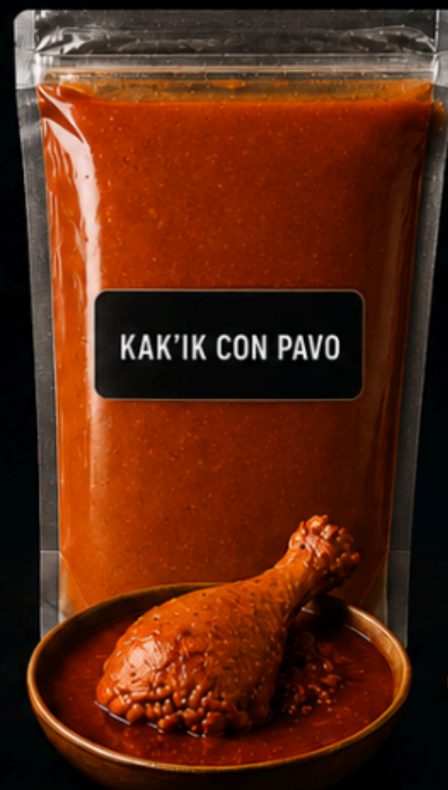
KAK'IK CON PAVO

Preparado con pierna cuartii de pollo, en recado tradicional de pepián de Chimaltenango. Color único y especiado.